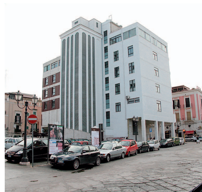
Palazzo di Città visto da piazza Plebiscito

Barletta, anche la lista civica «Voglio Te» abbandona la coalizione