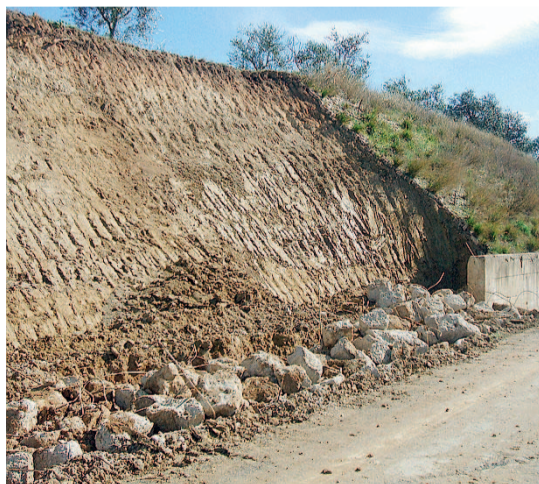
PRIMA Lo smottamento

Come già più volte richiesto sempre dal Comitato e riportato a più riprese dalla Gazzetta, al termine di questa inderogabile opera di rifacimento della sede stradale, l'Anas è stata invitata a provvedere alla rimozione dei rifiuti abbandonati indiscriminatamente sulle rampe di accesso allo svincolo: un bruttissimo biglietto da visita verso Canne della Battaglia, esempio di degrado ambientale e di continuo attacco al paesaggio.