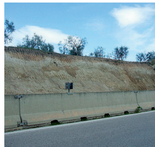
DOPO Il costone messo in sicurezza